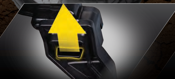
Clipless Body Mounting