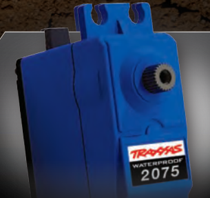
High-Torque Digital Steering Servo