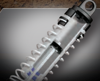
Oil-Filled Ultra Shocks™