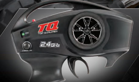
TQ™ 2.4GHz Radio System